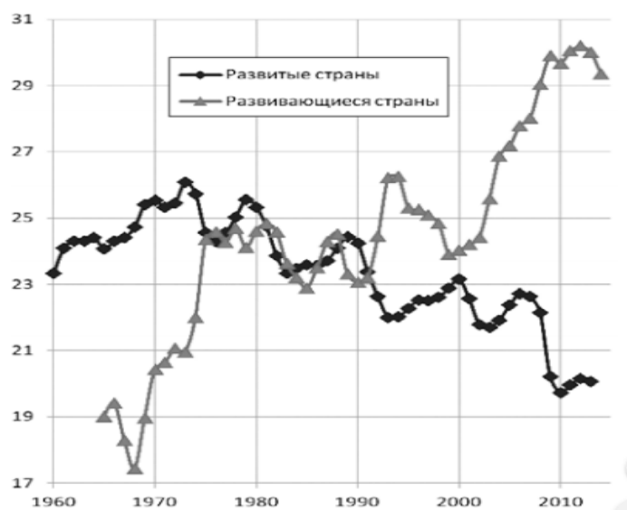
Таблица 2. Динамика доли инвестиций в ВВП развитых и развивающихся стран в 1960–2014 гг., в %

Еще более показательными являются темпы роста инвестиций в развитых странах (черным цветом) и развивающихся стран (серым цветом), представленные в Таблице 2